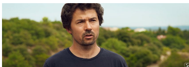
Domaine de l'Accent - Terrasses du Larzac Deuxième prix