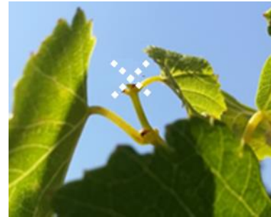
Les apex en arrêt de croissance

Lorsque les deux dernières feuilles étalées sont repliées le long de l'axe du rameau, celles-ci recouvrent l'apex.