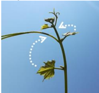
Les apex en pleine croissance

Lorsque les deux dernières feuilles étalées sont repliées le long de l'axe du rameau, celles-ci ne recouvrent pas l'apex.