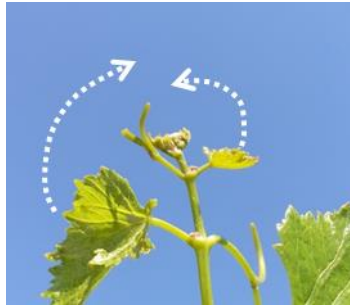
Les apex en croissance ralentie

Lorsque les deux dernières feuilles étalées sont repliées le long de l'axe du rameau, celles-ci recouvrent l'apex.